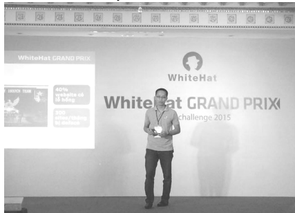
Đại diện Bkav tại cuộc họp báo.

toàn thông tin có quy mô toàn cầu đầu tiên do Việt Nam tổ chức.