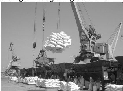
Cơ hội cho gạo Việt Nam vẫn rất lớn

Gia hạn thời gian cho vay tạm trữ thóc gạo là một trong những giải pháp được Chính phủ triển khai nhằm thúc đẩy tăng trưởng xuất khẩu gạo những tháng cuối năm.