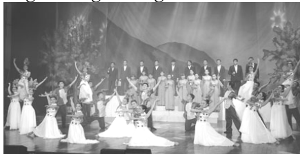
Một tiết mục của đoàn Ca múa nhạc tỉnh BR-VT tại cuộc thi.

Sau 10 ngày diễn ra sôi nổi, cuộc thi Ca múa nhạc chuyên nghiệp toàn quốc đợt 2 năm 2015 đã chính thức khép lại tại Trung tâm Văn hóa tỉnh (TP. Bà Rịa). Đoàn Ca múa nhạc BR-VT giành 2 HCV, 2 HCB tiết mục và giải Vàng chương trình