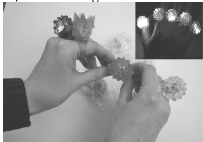
Nhãn phát sáng

Không rõ nguồn gốc, chất lượng, những món đồ chơi phát sáng đang được giới trẻ ưa thích và săn lùng tìm mua. Tuy nhiên, với những trẻ nhỏ bộ phận pin nhỏ để thấp sáng đèn bên có thể khiến trẻ ngạt thở, thậm chí tử vong nếu trẻ nuốt chúng.