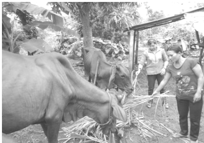
Phụ nữ xã Láng Lớn (huyện Châu Đức) chăn nuôi bò dê ổn định kinh tế gia đình.

Với mong muốn hỗ trợ phụ nữ nghèo có điều kiện làm ăn, phát triển kinh tế gia đình, hàng năm, Hội LHPN tỉnh phối hợp với Ngân hàng Chính sách xã hội (NHCSXH) thực hiện ủy thác cho vay hộ nghèo bằng nguồn vốn ngân sách địa phương.