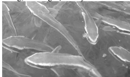
Cá bớp nuôi lồng bè trên sông Chà Và – xã Long Sơn

Ngoài ra, đối với các hộ nuôi mới cũng cần chú ý tránh xa những nơi gây ô nhiễm dầu, ô nhiễm chất thải công nghiệp, nước thải sinh hoạt và tàu bè qua lại nhiều, chọn những nơi nằm trong vùng quy hoạch của chính quyền địa phương, thuận lợi giao thông, dễ dàng vận chuyển.